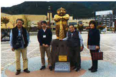
鬼怒太の湯（足湯）の管理状況を確認