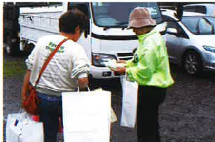
あかね祭でPRチラシ及び記念品の配布