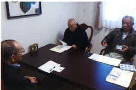
事業所へ訪問し新規就業先の開拓