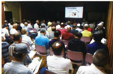
『高齢者の健康管理について』の講義