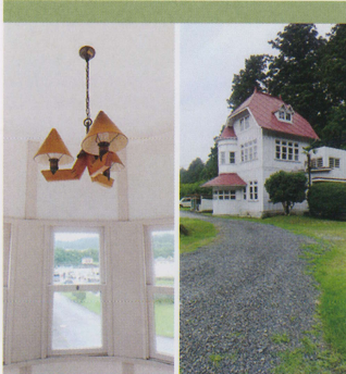
※旧管理棟照明と全景