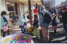
むかしの遊びも人気