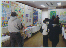
児童クラブ作品展