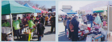
模擬店や販売コーナーは大盛況でした