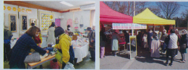
いきいきシルバー会員 作品展即売会のようす