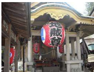
数奇な運命を辿った追分地藏尊