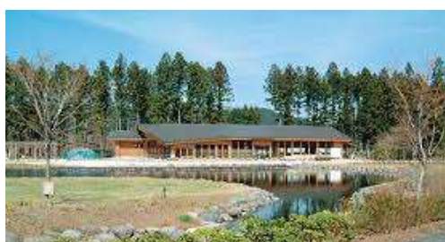
だいや川体験館（ミニ東照宮展示）

⇒ ひえ 日枝神社（野口）⇒ いきわか 生岡神社（七里）⇒だいや川体験館ミニ東照宮