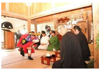
生岡神社の子供強飯式