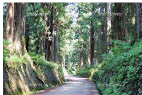
世界最長の杉並木でギネス登録