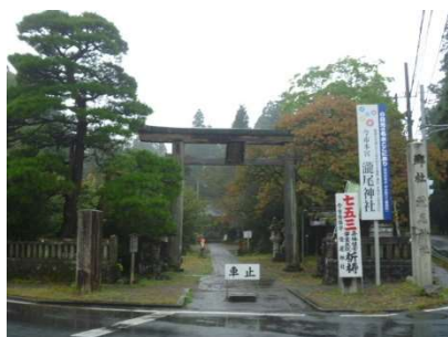
知る人ぞ知るパワースポットがある瀧尾神社