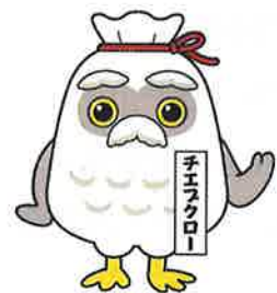
シルバー人材センターゆるキャラ 「チエブクロー」

シルバー派遣事業では安全・適正に働いていただくために、シルバー派遣事業就業規則（約束ごと）を定めています。